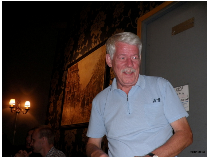
E uppspelt B. Britmer

Text: H-L Peterson