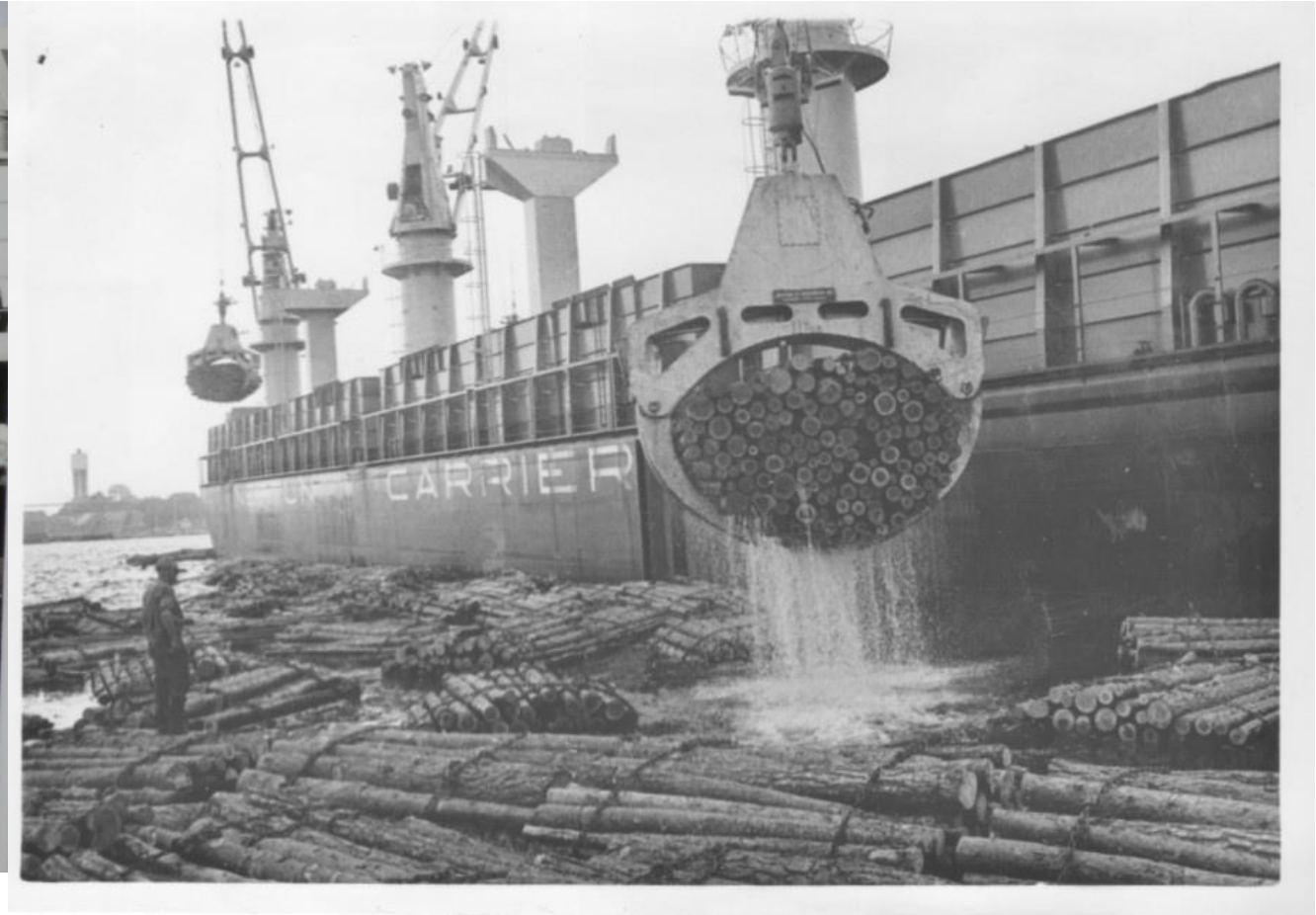
Hera premiär i Karlshamn 1969