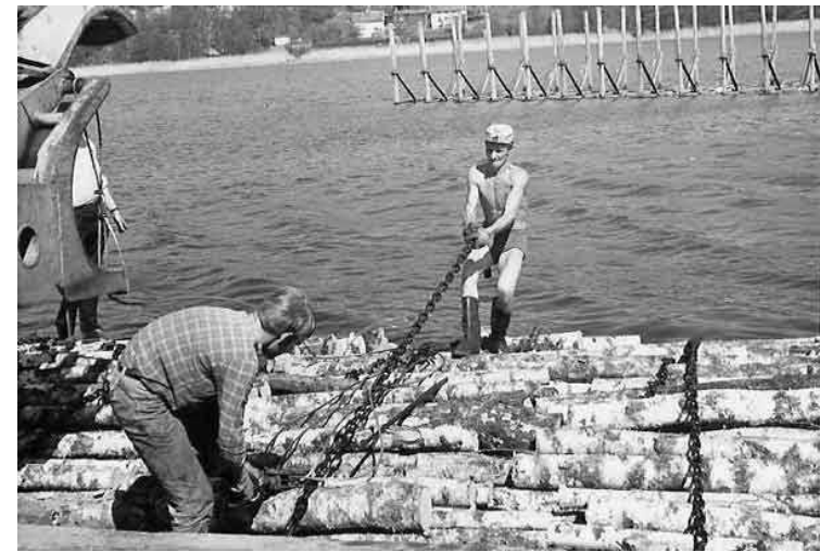
Tungt och riskfyllt arbete