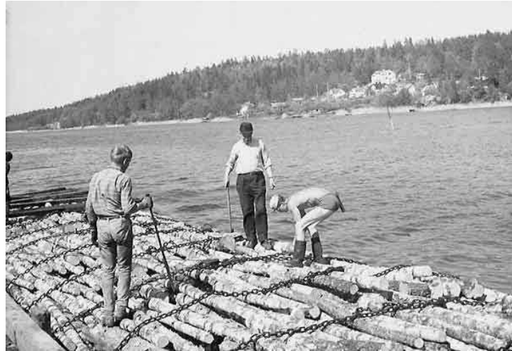
Tungt och riskfyllt arbete