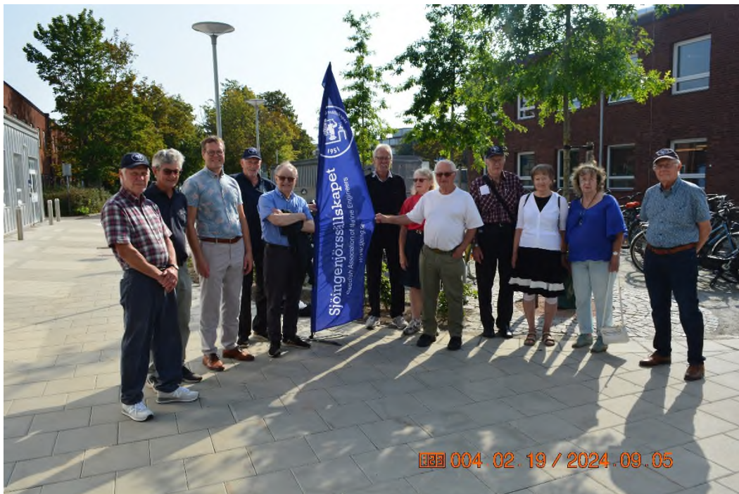
Medlemmar av Sjöingenjörssällskapet.